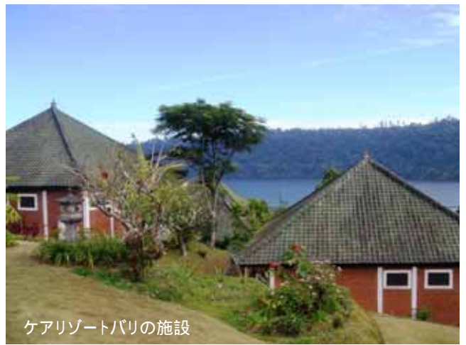
ケアリゾートバリの施設