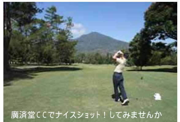
廣濟堂CCでナイスショット！してみませんか

ケアリゾートバリのメンバー有志の方々が中心に企画して下さったオープンゴルフ大会。記念すべき第1回なので、奮って皆様にご参加いただければ嬉しいです。気候のいい6月にお馴染みのバリハンダラ廣濟堂で開催します。詳細は後日有志の方からご案内させていただきますが、年頭に告知させていただきます。ラウンド終了後、ケアリゾートバリで表彰式とバリ舞踊鑑賞の予定です。