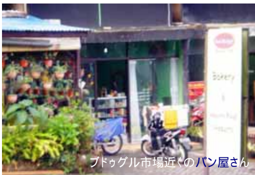
ブドゥグル市場近くのパン屋さん

お米が年に3回も収穫されるバリですが、欧米型の食生活も徐々に浸透してきています。ブドゥグルの市場近くに小さいですが、パン屋さんがオープンしました。通り道なので一度お試しあれ。